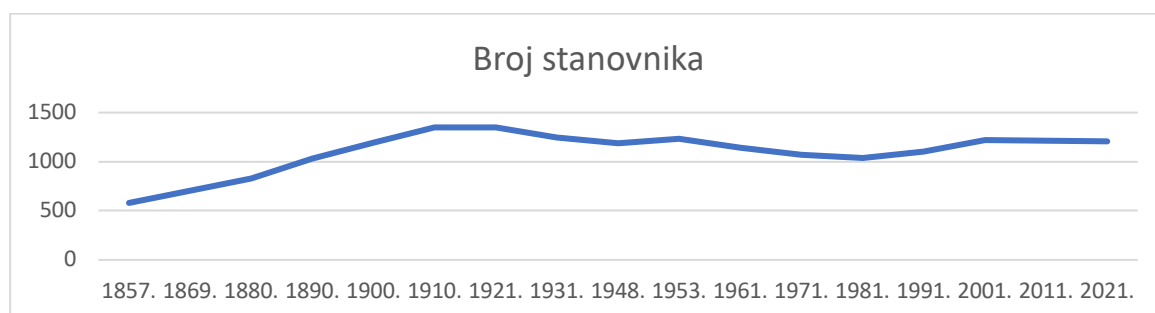
Grafikon 1. Prikaz kretanja broja stanovnika Općine Lumbarda u razdoblju 1857.-2021. 11

Kretanje broja stanovnika 1857. – 2021. prema popisu naselja i stanovništva RH prikazuje da je najveći broj stanovnika u Općini živjelo u periodu između 1910. i 1921. godine. U usporedbi s popisom iz 2021. radi se o razlici od 140 stanovnika manje koji danas žive u Općini.