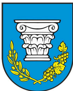
Slika 2. Grb Općine Lumbarda

Statutom Općine podrobnije se uređuje samoupravni djelokrug Općine Lumbarda, njezina obilježja, javna priznanja, ustrojstvo, ovlasti i način rada tijela Općine, način obavljanja poslova, oblici konzultiranja građana, provođenje referenduma u pitanjima iz djelokruga, mjesna samouprava, ustrojstvo i rad javnih službi, suradnja s drugim jedinicama lokalne i područne (regionalne) samouprave, te druga pitanja od važnosti za ostvarivanje prava i obveza Općine.